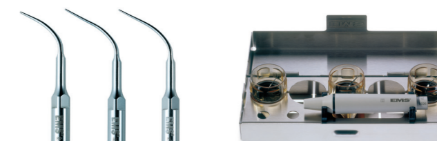
Swiss Instruments A, P, PS